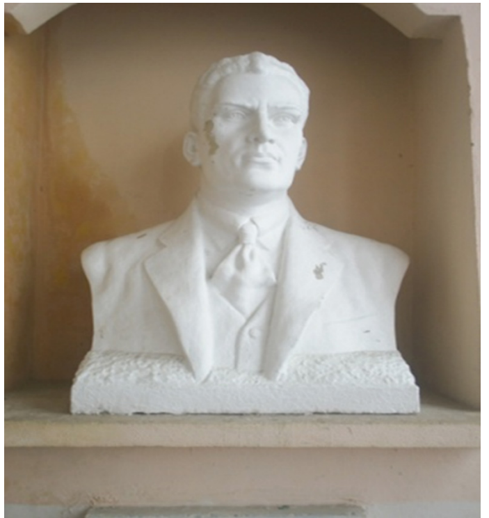
Anexo 4. Parte superior del busto que se encontraba en el Parque Martí, rescatado y conservado en el patio del Teatro Tomas Terry.