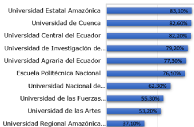
Figura 2. Universidades con la menor ejecución presupuestaria promedio de los años 2016 al 2019.

Por otra parte, en la Figura 2 se observa un contraste, existen universidades públicas con una ejecución presupuestaria muy baja, para los recursos recibidos.