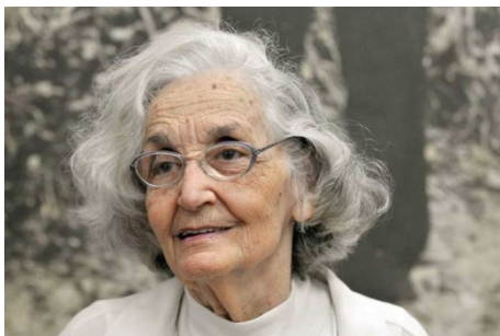
Figura 1. Fina García Marruz.